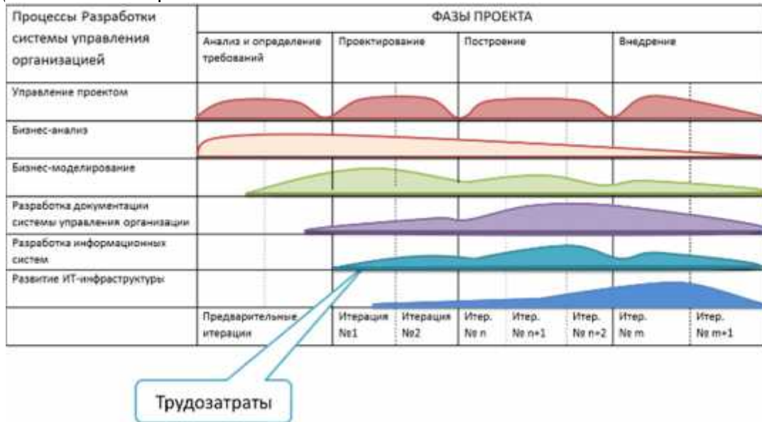
Рисунок 3. Итерационный процесс разработки системы управления организации

В результате получается следующая концептуальная модель построения системы управления организации, аналогичная RUP — Рисунок 3. Естественно, отображение трудозатрат выглядит несколько утрированно, но, тем не менее, оно даёт представление о том, как распределять ресурсы в ходе выполнения проекта.